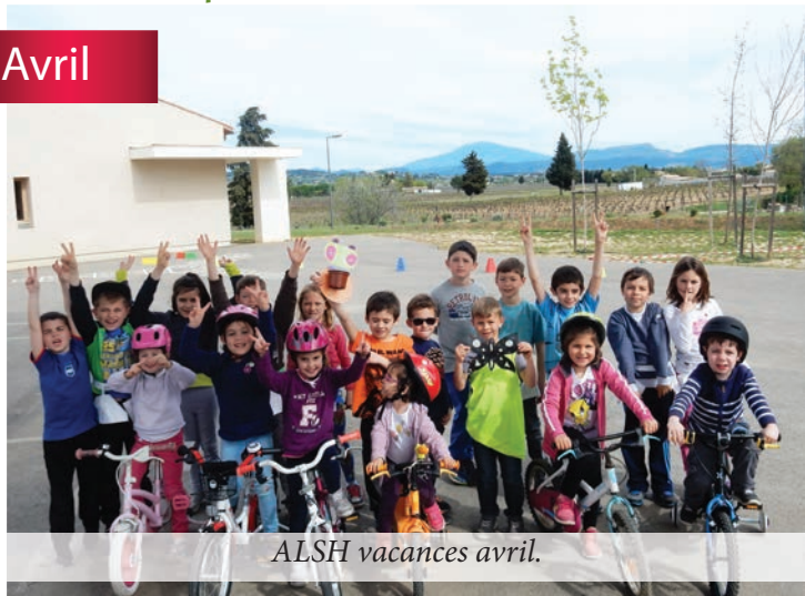
ALSH vacances avril.