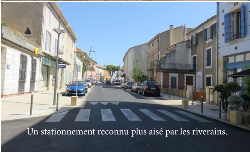
Un stationnement reconnu plus aisé par les riverains.