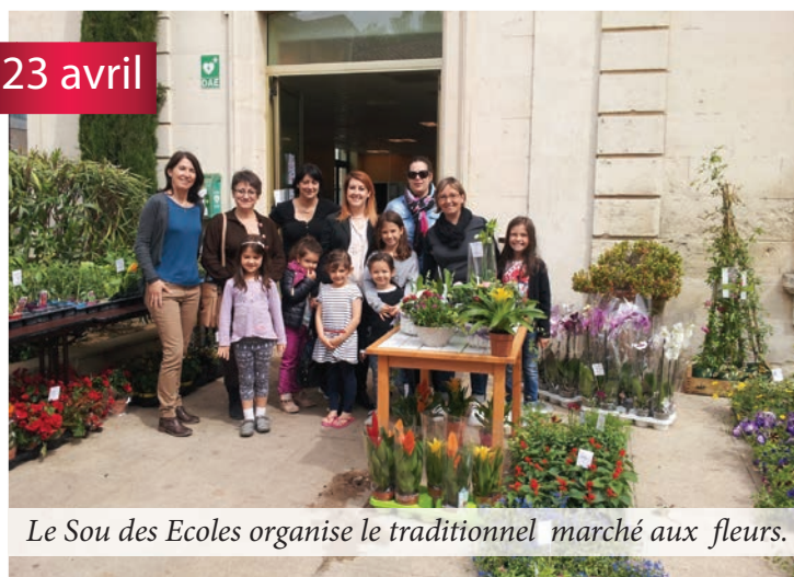
Le Sou des Ecoles organise le traditionnel marché aux fleurs.