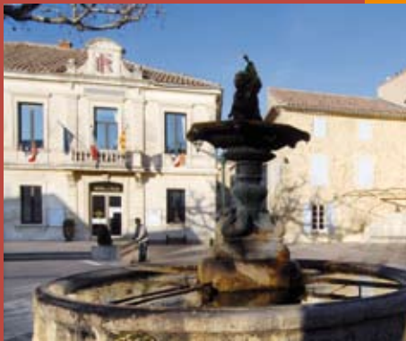
L'information municipale en direct