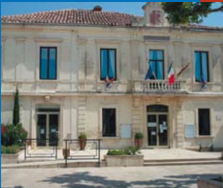
Félicitations à GÉRARD DEBEAUVAIS, présent pour les plus démunis