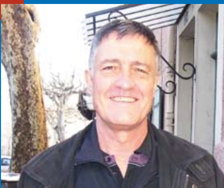
L'information municipale en direct