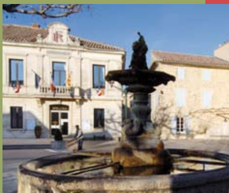
L'information municipale en direct