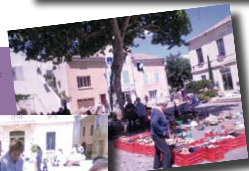
Vide grenier du Sou des Ecoles