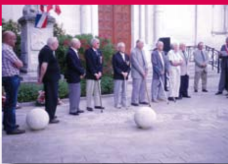
71ème anniversaire de l'Appel Historique du 18 juin 1940