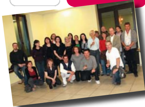
AG des commerçants, artisans et vignerons