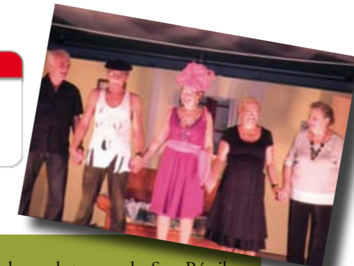
Matinée théâtrale avec la troupe « les Sans Réveil » de Bollène offerte par le comité des fêtes