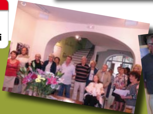
Exposition Pierre Salinger