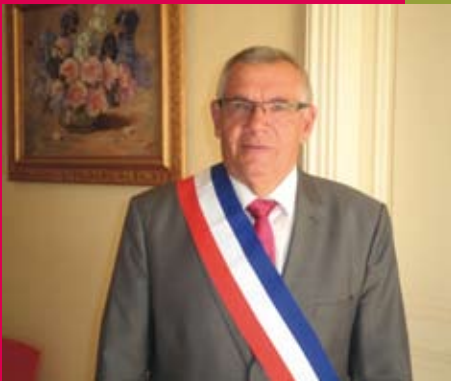
L'information municipale en direct