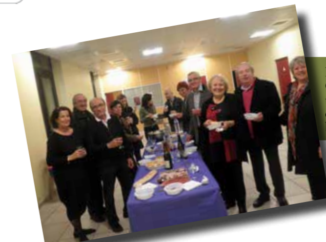
Première Assemblée Générale de l'association Art des Arts. Le deuxième salon est sur la bonne voie.