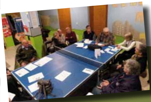
Assemblée générale de l'Ecole Marius André. Galette des Rois.