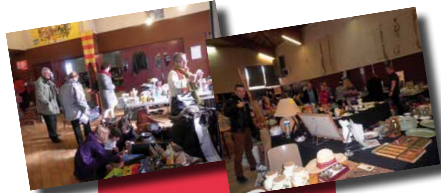
Vide grenier de l'association pour la sauvegarde du patrimoine. Un vif succès. Salle Camille Farjon