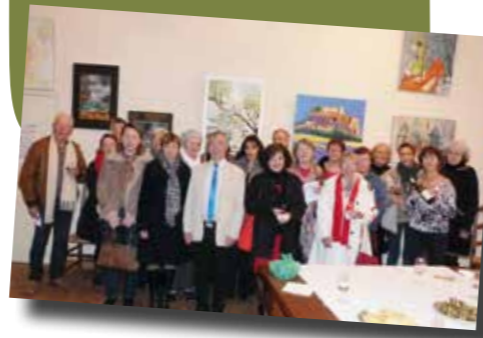
Fête des Arts et de la gastronomie à Chantecôtes. 23 artistes fidèles aux expositions annuelles.