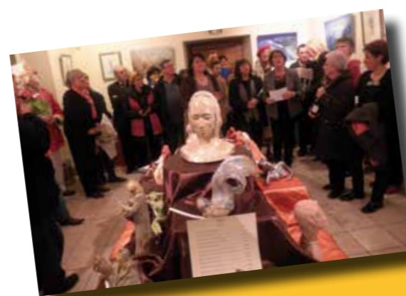
Concours des crèches. Tous les participants ont été récompensés.