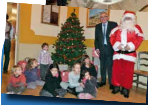
Le Père Noël s'invite à la mairie pour offrir des cadeaux aux enfants des employés communaux.