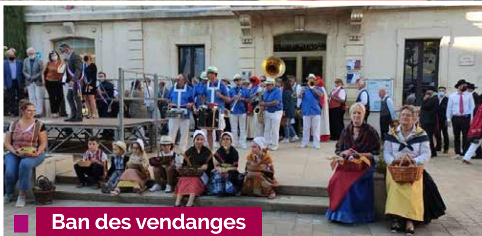
Ban des vendanges