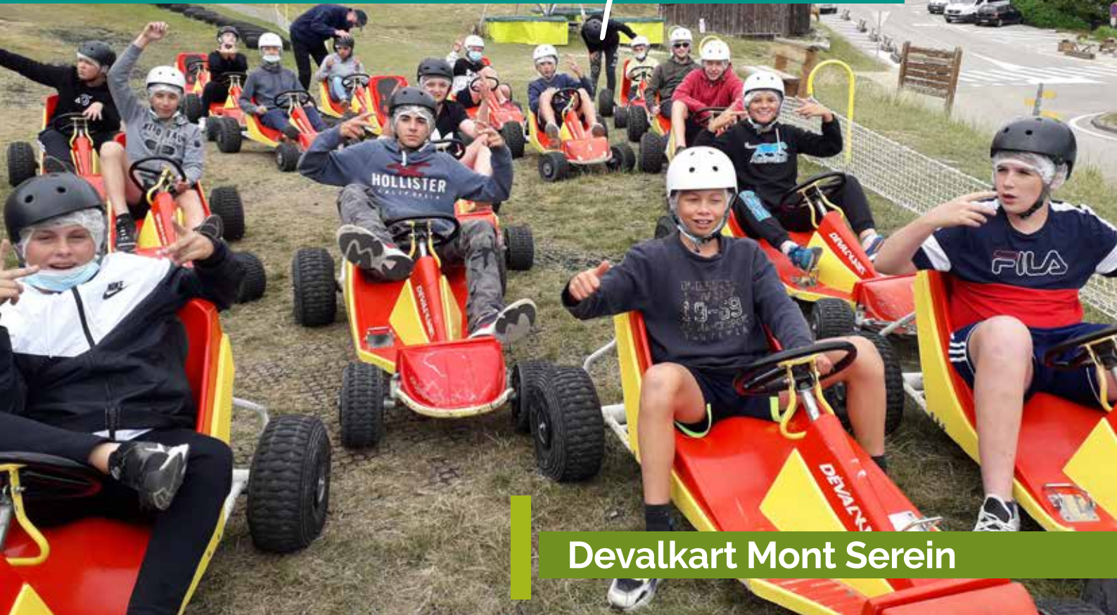
Devalkart Mont Serein