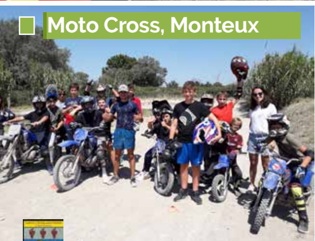
Moto Cross, Monteux