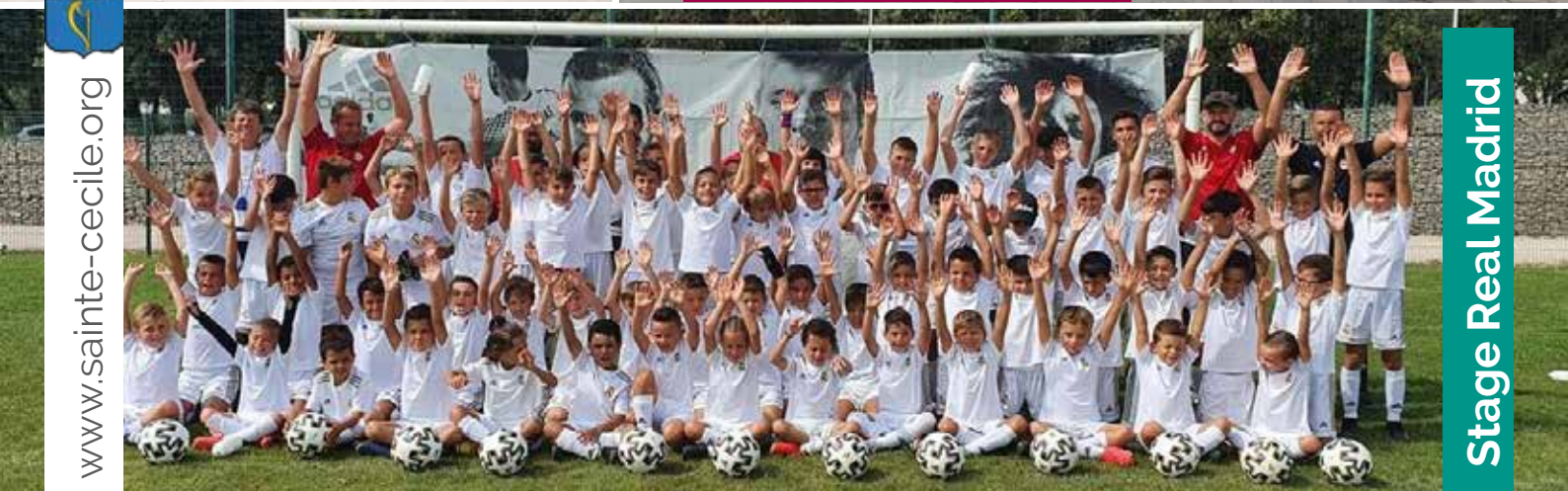
Stage Real Madrid