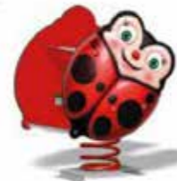
la coccinelle ressort