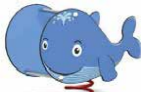
la baleine ressort