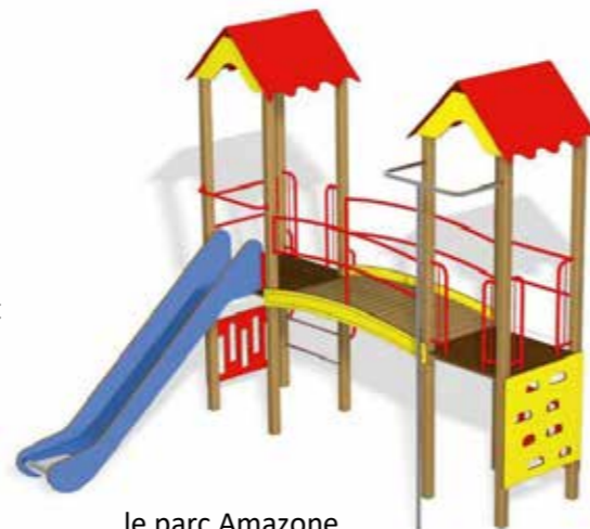
le parc Amazone