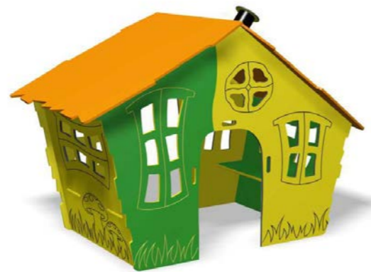
la maison des elfes