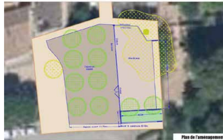
Plan de l'aménagement